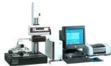
Digitalkontrollanlage der Abmessungen bewacht die Genauigkeit Ihrer Werkstücke