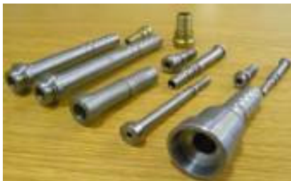
Teile für Schlauchanschlüsse