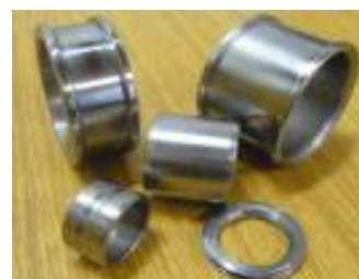
Sortiment ložiskových kroužků.