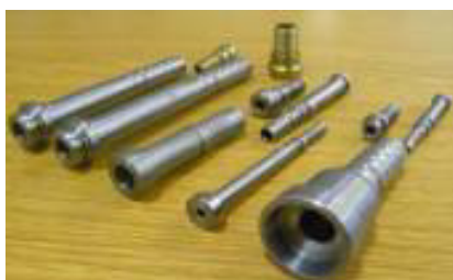
Sortiment hadicových koncovek pro hydrauliku.